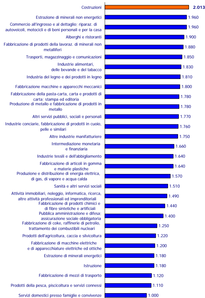
EFFETTO DIRETTO E INDIRETTO SULL'ECONOMIA NAZIONALE ATTIVATI DA UNA DOMANDA FINALE DI 1.000 MILIONI DI EURO RIVOLTA A TUTTI I SETTORI DI ATTIVITA' ECONOMICA - Milioni di euro

Si noti come l'attivazione totale (effetto diretto ed indiretto) generata sull'economia è maggiore laddove la spesa iniziale è rivolta al prodotto costruzioni (2.013 milioni di euro complessivi).