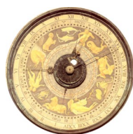
Ordine degli Ingegneri