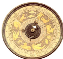
Ordine degli Ingegneri